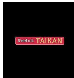
リーボック 「TAIKAN パフォーマンスを引き出すウェア」 (バドミントンチーム：あひる団)