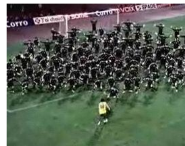
三井住友海上 「GK 大きな安心篇/GK 多めの安心篇」 (サッカー：ユキヒデ)